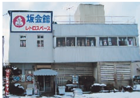
外から見れば「不思議館」の印象 レトロラン時代を記憶している人もいるかも

「礼文島から沖縄まで全国を歩いて、個人の方から譲ってもらいました。雑誌などは一山いくら。古くなった物が安かった時代です」。収集物の原則は、骨董品としては出回らない物。私たち戦中生まれは です。ですから収集しながら時代の変遷も見てきました。バブルの頃は、中身ごと解体する家の道具をタバコケースほどのお礼で持ち出したり、札幌市の大型ゴミ収集が有料になるときは市内のあちこちでたくさん集められたり――。 一般公開は十二年 前。きっかけは五十年代にさしかかって、乗り物で席を譲られることが多くなったことへの感慨から。倉庫に眠っている道具たちにも余生、安住の場が必要でした。カメラや蓄音機などはすべて自ら修理していつでも使える状態に。人形や雑誌類のガラスケースも手製です。鮮やかなガラス切りのテクニクを見せてもらいました。 ここの特徴はもう一つ。旧日本軍関係の物もあれば火鉢、映写機もある。そしてヌードピンナップも――時代を正確に伝えたいという館長の信念が、戦前からの生活文化史や社会風俗史もわかりやすく構成しています。 最近では本州からの見学者やアーティストを目指す若者などの来館が増加。