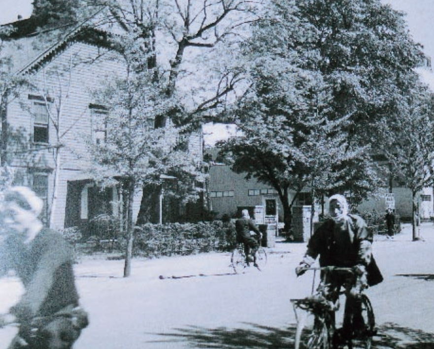
上:1952年(昭27)6月、札幌市立図書館前通り (札幌時計台が図書館だった) 左:旧札幌市立図書館 (中央区北2西12、昭53.4撮影)