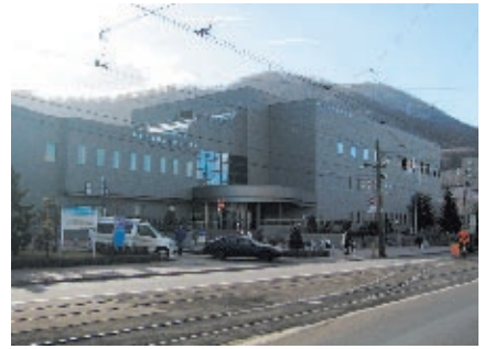
現在の札幌市中央図書館(中央区南22西13)