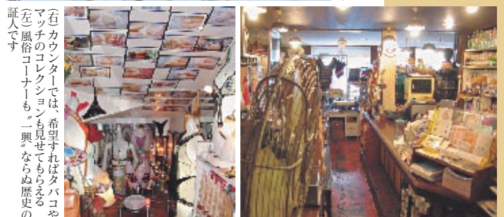
（右）カウンタレでは、希望すればタバコやマチのコレクションも見せてもらえる （左）風俗コーナーも二興なら歴史の証人です