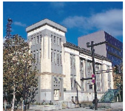
上:威厳がある旧道立図書館の建物(中央区北1西5) 下:現在の道立図書館(江別市野幌)

以後、ことある ごとに公共図書館 の必要性が叫ばれ、 明治二十三年、教 育従事者によって 創設された北海道 教育会が道庁北門 前に建築した同会 付属図書館が、札