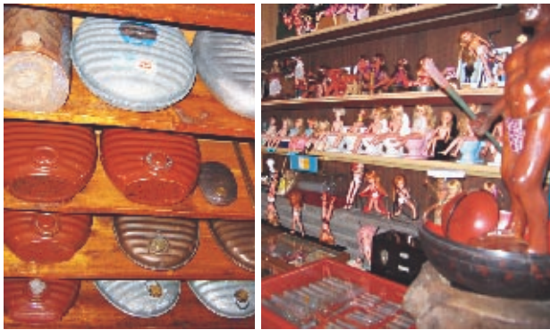
昔なつかしい生活用具や人形、文房具などのコーナーに分かれている ぐるり巡ればちょっと歴史を旅した気分

「礼文島から沖縄まで全国を歩いて、個人の方から譲ってもらいました。雑誌などは一山いくら。古くなった物が安かった時代です」。収集物の原則は、骨董品としては出回らない物。私たち戦中生まれは です。ですから収集しながら時代の変遷も見てきました。バブルの頃は、中身ごと解体する家の道具をタバコケースほどのお礼で持ち出したり、札幌市の大型ゴミ収集が有料になるときは市内のあちこちでたくさん集められたり――。 一般公開は十二年 前。きっかけは五十年代にさしかかって、乗り物で席を譲られることが多くなったことへの感慨から。倉庫に眠っている道具たちにも余生、安住の場が必要でした。カメラや蓄音機などはすべて自ら修理していつでも使える状態に。人形や雑誌類のガラスケースも手製です。鮮やかなガラス切りのテクニクを見せてもらいました。 ここの特徴はもう一つ。旧日本軍関係の物もあれば火鉢、映写機もある。そしてヌードピンナップも――時代を正確に伝えたいという館長の信念が、戦前からの生活文化史や社会風俗史もわかりやすく構成しています。 最近では本州からの見学者やアーティストを目指す若者などの来館が増加。