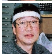
長兄・洋さんと末弟・治 さん（下）の二人三脚