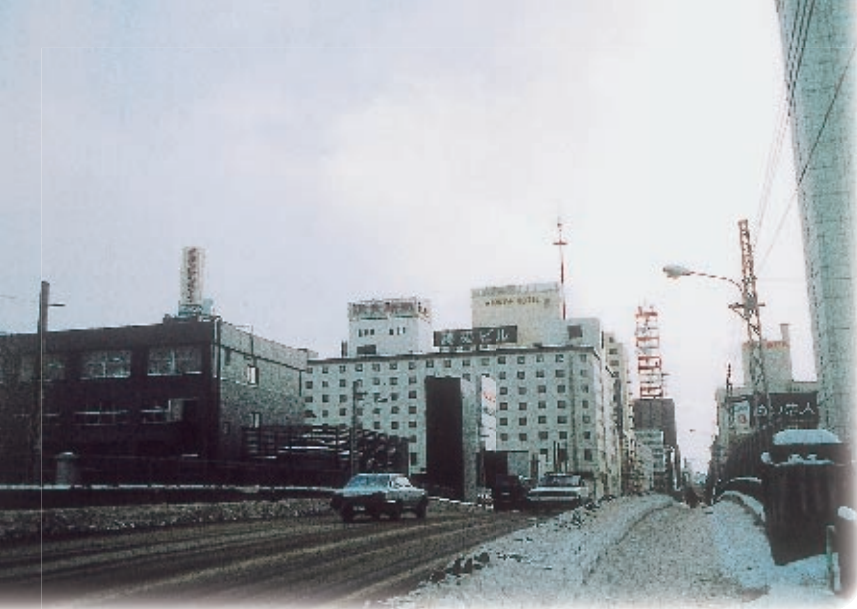
おかばし。こんなでした——昭和59年1月撮影